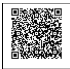
iPhone QR 码