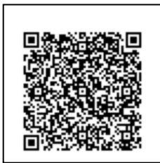
Android QR 码