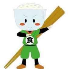
宇都宮市食育卡通角色

除此之外, 尽量不要留饭菜、一家人或朋友们经常一起共餐等, 也是很重要的。让我们欢聚一堂, 品尝美食, 维护身心健康!