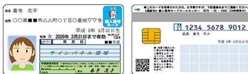
個人番号カードイメージ