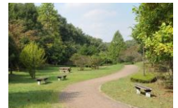
ながおかしちしゅうへん 長岡湿地周辺