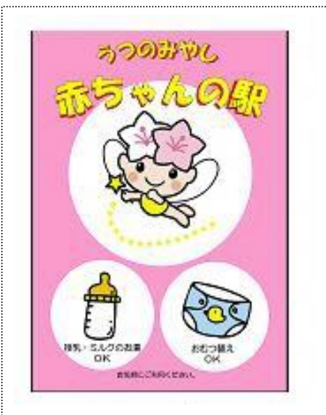
赤ちゃんの駅が目印