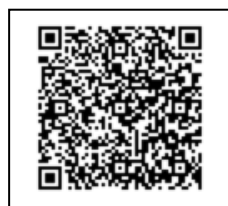
iPhone QR code