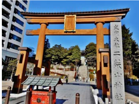
Vista de Torii pela avenida Odori

Vamos conhecer a cultura japonesa! Vou explicar um pouco sobre o Templo Utsunomiya Futaarayama jinja onde será realizado o Festival Otariyasai apresentado na página 2.