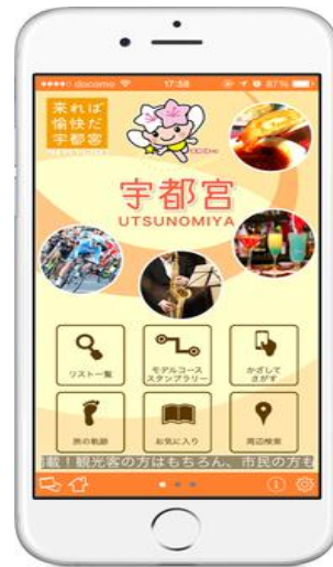
ไอโฟน (iPhone) QR code