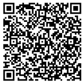
QR Code สำหรับ iPhone

สามารถใช้ได้ทั้ง ภาษาญี่ปุ่น ภาษาอังกฤษ ภาษาเกาหลี และภาษาจีน (อักษรพินอิน)