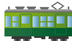
< เครื่องหมาย IC >

ขอให้ใช้ได้สะดวกและเที่ยวให้สนุกนะครับ โอเบนโตะที่ขายในสถานีก็อร่อยนะครับ !