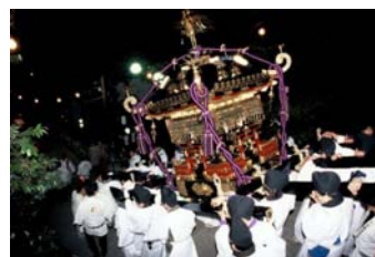
กำหนดเวลา