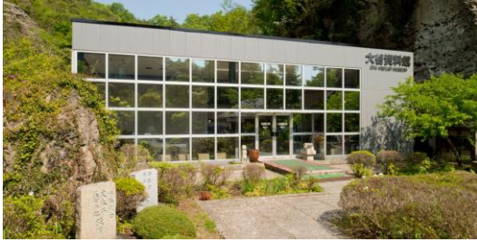
Bên ngoài tòa nhà

Giới thiệu viện tư liệu OOYA , một trong những điểm du lịch nổi tiếng lịch nổi tiếng của thành phố Utsunomiya