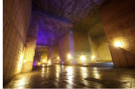
Không gian bên trong

Động nhân tạo dưới lòng đất của viện tư liệu OOYA được đào từ năm 1919 tới năm 1986, là một công trình bên trong của một hòn đá khổng lồ OOYAISHI .Với độ lớn là 20,000m 2 (140mx150m 2 ), nó tương đương với một sân bóng chày. Nhiệt độ bên trong hầm luôn thấp hơn 8°C so với nhiệt độ thường nên nó giống như một cái tủ lạnh to giữa lòng đất. Trong thời chiến tranh, hầm được sử dụng như một xưởng bí mật dưới. Sau chiến tranh, hầm được sử dụng như một cái kho đựng gạo của chính phủ. Hiện nay, nó còn được sử dụng làm sân khấu hòa nhạc hoặc quay phim.