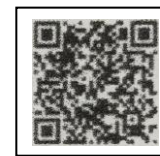
< iOS >

※ Những điện thoại có phần mềm iOS 9.3 trở đi hoặc sau Android 5 có thể sử dụng được.