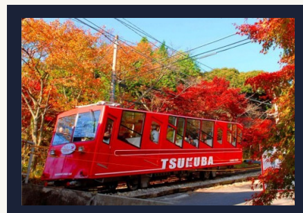
Take the cable car to the top of Mount Tsukuba! 筑波山ケーブルカー