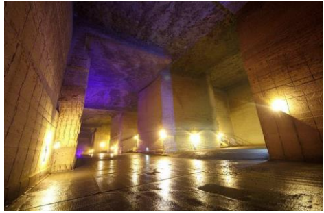
巨大采掘场遗迹（地下空间）

大谷资料馆的地下采掘场遗迹是从 1919 年到 1986 年，经过大约 70 年左右的时间挖掘大谷石而形成的非常巨大的地下空间。其宽度为两万平方公里（140m×150m），大小相当于能容纳一个棒球场。馆内室温为平均 8 摄氏度左右，就像是庞大的地下冰箱一样。战争时期当作地下秘密工厂，战后被利用于政府的粮食仓库，如今以音乐会或电影摄影棚来使用。