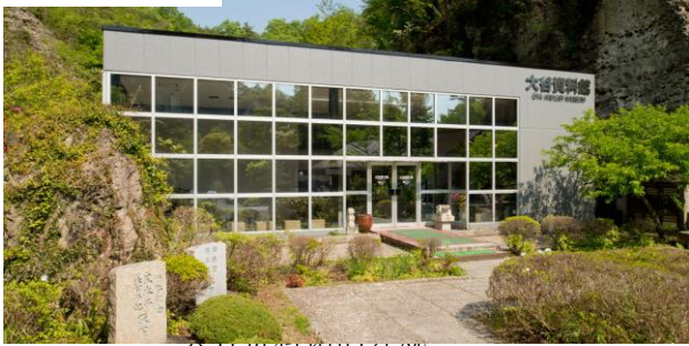
大谷资料馆的外观