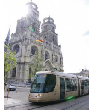
行驶在圣十字大教堂前的 LRT