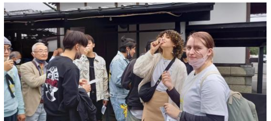
设施工厂参观会的清酒品尝体验

在 UCIA，除了日语教室和外语培训班外，还举办介绍日本文化，巴士团体旅游，设施工厂参观会，料理教室等各种各样的国际交流活动。