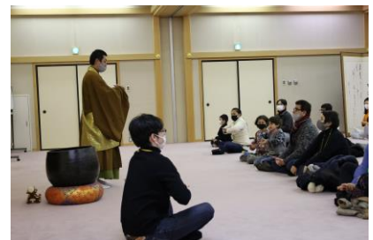
巴士团体旅游的坐禅体验