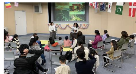
欣赏世界各国的绘本