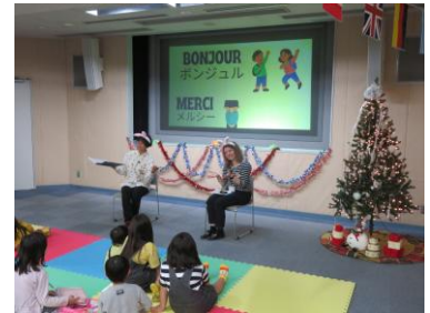
欣赏世界各国的绘本

与宇都宫市政府合作，开展接收姐妹城市学生（寄宿家庭）及初中生，高中生派遣等姐妹城市交流项目。