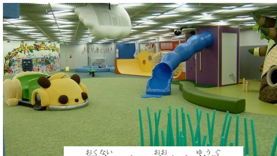
屋内にある大きな遊具

子どもたちのあそびひろばである「ゆうあいひろば」を紹介します。 同じ場所には、一時預かりやファミリーサポートセンターがあります。