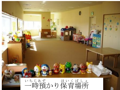
一時預かり保育場所

ゆうあいひろばは、うつのみや表参道スクエア6階にあります。大きな遊具などで遊んだり、工作教室などに参加できます。また、生後6か月から小学生になる前の子どもを預けられます。