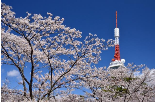
宇都宮タワーと桜

まだ、寒い日が続いていますが、毎年3月下旬頃から4月上旬にかけて、桜が咲きます。桜がたくさんあり、名所の一つである八幡山公園を紹介しします。是非、行って見てね。