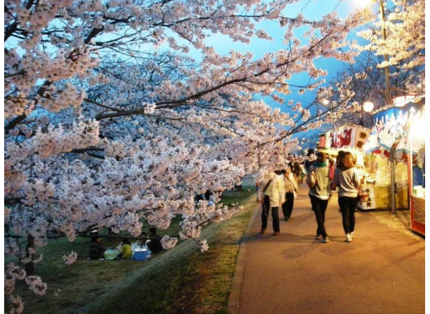
屋上で長い物が映えたり

八幡山公園は、宇都宮市の中心部にある公園です。市内を見渡せる宇都宮タワーや、子ども向けの大きな滑り台などの遊具やゴーカートなどで楽しめます。4月1日は宇都宮市民の日で、宇都宮タワーは無料で入れます。 電話：028-624-0642 住所：宇都宮市埴田5-1-1 HP：http://hatimanyama.jp/ 休園日：公園は年中無休。ただし、宇都宮タワー・ゴーカートは月曜日（月曜日が祝日の場合は火曜日）と年末年始（12月29日～1月3日）が休み。