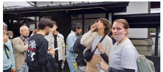
施設工場見学会で日本酒試飲体験

UCIA では、日本語教室や外国語講座、日本文化の紹介、バスツアー、施設工場見学会、料理教室など、いろいろな国際交流をやっているよ。