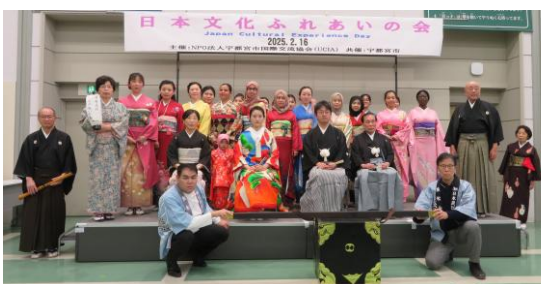
にほんぶんかたいけん 日本文化体験

4 ページにあるように、自分のことや出身国の ことを、みんなに紹介することもできるから、 ぜひぜひ、UCIA に一度遊びに来てください！