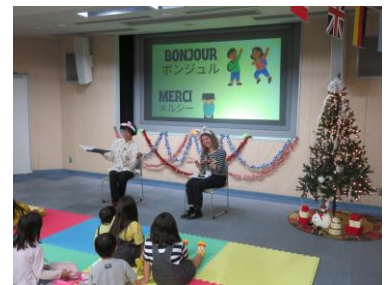
せかい えほん たの 世界の絵本を楽しもう

それから、うつのみやし きょうりよく しまいとし がくせいうけい ちゅうがくせい こうこうせい 学生受入れ（ホームステイ）や中学生や高校生など の派遣事業もやっているんだよ。