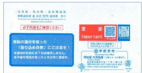
↑6月に届く納税通知書（封筒）