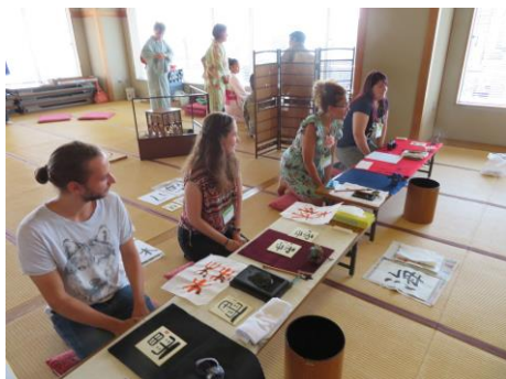
Caligrafia Shodo no período de homestay

Também oferecemos consultas aos estrangeiros (página 4) e serviços de interpretação e tradução (pago).