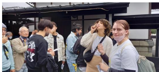
Degustação de Saquê no tour à fábrica

UCIA oferece aulas de japonês, cursos de línguas estrangeiras, introduções à cultura japonesa, passeios de ônibus, visitas às fábricas, aulas de culinária, realizamos vários intercâmbios internacionais.