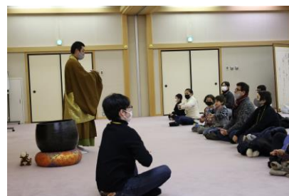
Prática de Zazen no passeio de ônibus

Vou convidar meus amigos e iremos conhecer a UCIA!