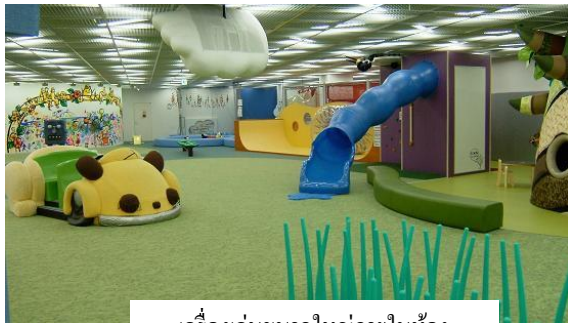
เครื่องเล่นขนาดใหญ่ภายในห้อง

รวมทั้งมีสถานที่รับดูแลเด็กชั่วคราวและแฟมิลี่ซัพพอร์ตเซ็นเตอร์อยู่ในสถานที่เดียวกัน