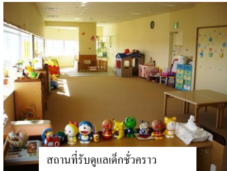
สถานที่รับดูแลเด็กชั่วคราว

ยูอาอิโรปะ อยู่ในอูชิโนมิยะ โอโมเตะซัน โดสเคอว์ ชั้น 6 สามารถเล่นเครื่องเล่นขนาดใหญ่ หรือห้องทำงานประดิษฐ์ นอกจากนี้ยังรับดูแลเด็กตั้งแต่ 6 เดือนถึงชั้นประถม