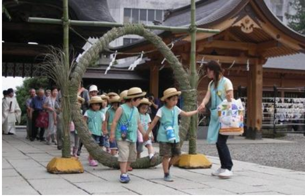
เด็กๆ เตินลอดห่วงฟาง

พิธีโอสารอิ คือกิจกรรมที่ทำขึ้นเพื่อไม่ให้ผู้คนเจ็บป่วย และเพื่อไม่ให้เกิดสิ่งเลวร้าย เป็นกิจกรรมที่ทำมาตั้งแต่ปี 701 ในวันที่ 30 มิถุนายนและ 31 ธันวาคมของทุกปี ห่วงฟางวงกลมทำมาจากต้นหรือใบของหญ้าแห้วหมู นำมาพันให้เป็นรูปร่างกลมขนาดประมาณ 2 เมตร มีการกล่าวไว้ว่าหากลอดห่วงวงกลมนี้จะห่างไกลจากโรคและสิ่งชั่วร้าย และมีอายุยืนนาน วันเวลา วันอาทิตย์ที่ 30 มิถุนายน 15 : 00 ~ 15 : 40 (กำหนดการ) สถานที่ ศาลเจ้าอุชิโนมิยะฟูตาอารายมะจินจะ (อุชิโนมิยะชิ บาบาคิริ 1-1-1) ติดต่อสอบถาม ศาลเจ้าอุชิโนมิยะฟูตาอารายมะจินจะ ☎028-622-5271