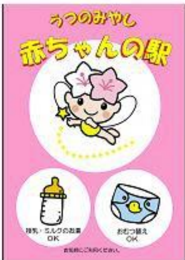
สัญลักษณ์อากะจิงโนะเอคิ