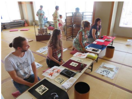
พักโฮมสเตย์ สัมผัสประสบการณ์การเขียนฟูกัน