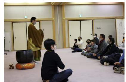
บัสทัวร์ สัมผัสประสบการณ์การนั่งสมาธิ

แล้วก็มี การให้คำปรึกษาแก่ชาวต่างชาติ (หน้า 4) บริการล่ามภาษา แปลเอกสาร (มีค่าใช้จ่าย)