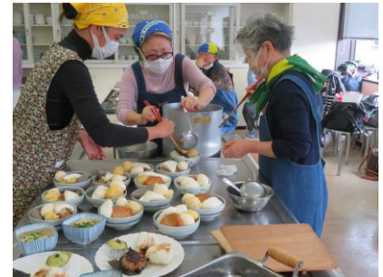
ห้องเรียนทำอาหารญี่ปุ่น

และร่วมมือกับอำเภออุซึโนมียะ จัด โครงการโฮมสเตย์รับนักเรียน และ ส่งนักเรียนมัธยมต้น มัธยมปลาย กับเมืองพี่เมืองน้อง