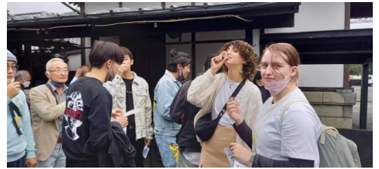
ทัวร์โรงงานชิมเหล้าญี่ปุ่น

UCIA มีการจัดกิจกรรมแลกเปลี่ยนระหว่างประเทศต่าง ๆ เช่น เปิดสอนภาษาญี่ปุ่น ภาษาย่างประเทศ การแนะนำวัฒนธรรมญี่ปุ่น ทัวร์รถบัส เชื่อมชมโรงงาน ทัวร์โรงงานและชั้นเรียน ทำอาหาร เป็นต้น