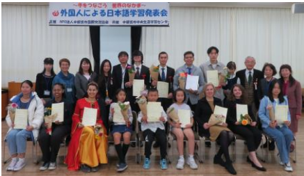
การแข่งขันสุนทรพจน์ภาษาญี่ปุ่น

UCIA : Utsunomiya City International Association