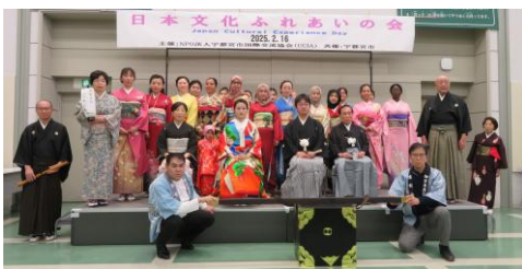
สัมผัสประสบการณ์วัฒนธรรมญี่ปุ่น

ตามที่เห็นในหน้า 4 คุณสามารถแนะนำตัวเองและประเทศของคุณ ให้ทุกคนได้ ดังนั้นเชิญมาเยี่ยมเราได้ที่ UCIA!