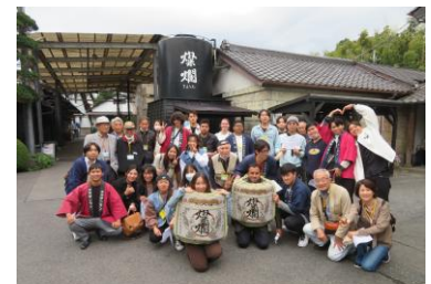
เยี่ยมชมโรงงาน

นอกจากนี้เรายังมีบริการให้คำปรึกษานานาชาติทั่วไป (หน้า 4) และ บริการล่าม/การแปลภาษา (มีค่าใช้จ่าย) สำหรับชาวต่างชาติ