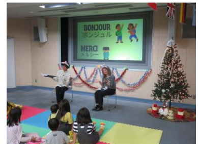
สนุกกับหนังสือภาพนานาชาติ

นอกจากนี้ ยังให้ความร่วมมือกับเมืองอุซึโนะมิยะ รับนักเรียนจากเมืองที่ เมืองน้อง (โฮมสเตย์) และส่งนักเรียนระดับมัธยมต้นและมัธยมปลาย ออกไป