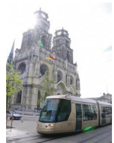
LRT chạy trước thánh đường Sante - Croix.