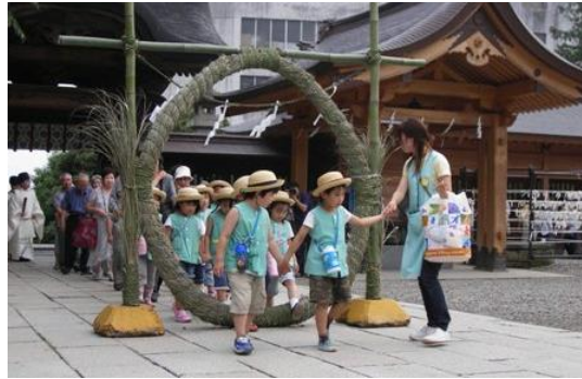
Các em nhỏ đang đi qua vòng tròn rơm

Nghi thức Oharai là nghi lễ cầu mong cho mọi người khỏe mạnh, không gặp điều xấu bất nguồn từ năm 701 và được thực hiện hàng năm vào ngày 30 tháng 6 và ngày 31 tháng 12.