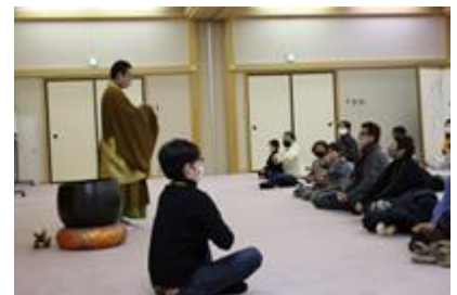
Trải nghiệm ngồi thiền trong chuyến tour xe bus

Thêm nữa, chúng tôi còn có góc tư vấn tổng hợp dành cho người nước ngoài (trang 4), dịch vụ phiên dịch, biên dịch (có tính phí) nữa đó.