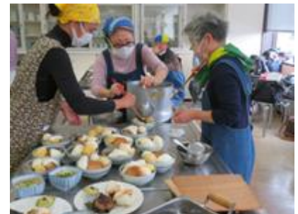
Lớp học làm món ăn Nhật Bản

Ngoài ra, chúng tôi còn hợp tác với các thành phố bạn, nhận học sinh tới trải nghiệm theo hình thức home stay và cử học sinh cấp 2 đi học hỏi ở các thành phố bạn nữa đó.