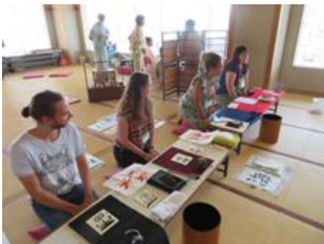
Trải nghiệm thư pháp tại gia

Lần tới mình sẽ rủ mọi người tham gia nha !