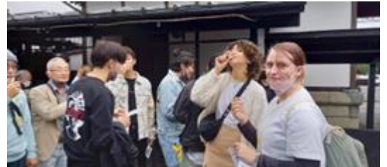
Trải nghiệm uống thử rượu trong chuyến đi thăm quan nhà máy