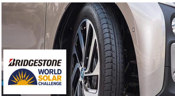
ブリヂストン栃木工場