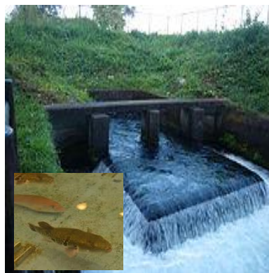
那須疎水&温泉とらふぐ